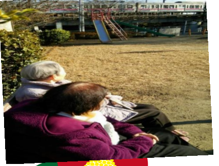
寒い中でも皆様散歩に出かけています(^_^)