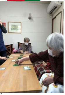
歌を歌ったり、かるたをしたり…室内ではほっこりと😊