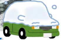
記録的な大雪でしたわ…

今年もまた頑張って参ります！ 様々な工夫を凝らして小規模 ならではの特徴を生かし、 お元気にご来所して頂けるよう 努めて参ります！！